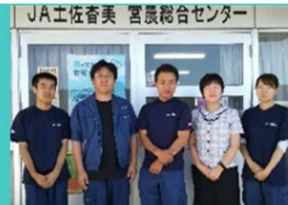
J A 土佐香美

研修中や就農後の、栽培技術や経営管理について、技術職員が地域の実績データに基づいた指導を行います。経営計画の作成も支援します。