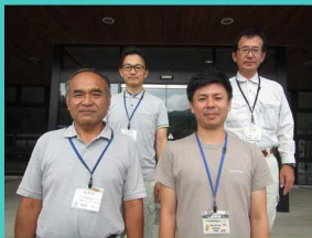
中央東農業振興センター

本気で頑張る人を応援します。研修から就農までの計画についてご相談ください。まずは私に相談してください。