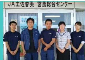
J A 土佐香美

本気で頑張る人を応援します。 研修から就農までの計画についてご相談ください。まずは私に相談してください。