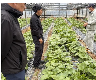
現地で生育状況を確認する生産者

3月25日、四万十市西土佐の葉ワサビ生産者ほ場2か所で、加工用葉ワサビの現地巡回を行い、生産者2名、実需者1名、関係機関4名が参加しました。