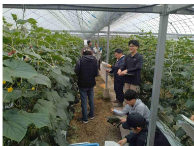
資料の説明を聞く生産者

3月18日、黒潮町浮鞭のキュウリ生産者ほ場2か所で、キュウリ若手現地検討会を開催し、生産者11名、関係機関5名が参加しました。