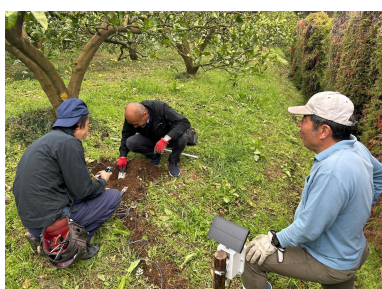
環境測定装置の設置状況を確認する生産者

3月19日、宿毛市宇須々木の土佐文旦生産者ほ場で、生産者2名が、環境測定装置を設置しました。