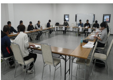
意見交換する参加者

4月15日、JA幡多地区本部で、JA青壮年部中村支部通常総会が開催され、部会員10名、関係機関10名が参加しました。