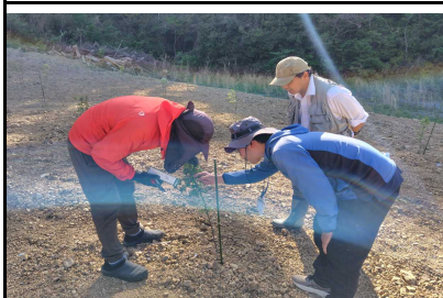
サンショウほ場の現地確認を指導する普及指導員

4月16日、佐川町で新たにサンショウ栽培を開始した新規栽培者の現地ほ場の確認を行いました。