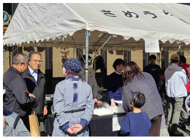
産業文化祭の様子

11月23日に、土佐町で産業文化祭が開催され、今回初めてお米のコンテストが行われました。併せて、コンテストで最も点数の高かったお米の試食も実施しました。