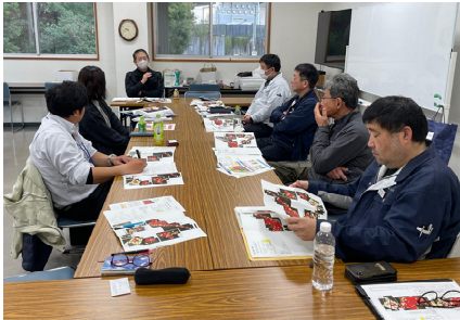
活動方針を協議する 水稲代表者と研究会員

2月16日、『J A土佐くろしお水田維持管理対策研究会』が水田維持管理の先行取組に向けた水稲代表者との意見交換会を開催し、須崎市安和の水稲代表者1人とJ A土佐くろしお村村営みのりを含む研究会構成員7人が今後の取組について協議しました。