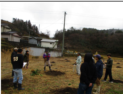
ユズ苗の状態について 説明をする普及職員

2月26日、J A高知県高西営農センター津野山ユズ部会で、令和7年度に果樹経営支援対策事業を活用して新植する農家を対象として定植講習会が開催され、8人が参加しました。