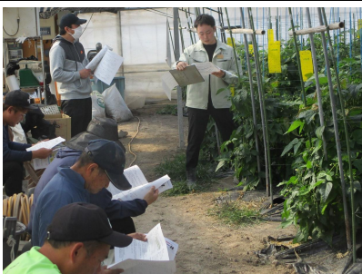
今後の栽培管理について 説明する普及職員

2月17日、須崎市及び中土佐町の生産者ほ場で、J A土佐くろしおインゲン部会が現地検討会を開催し、生産者13人が参加しました。