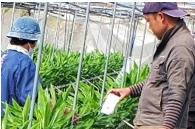
ミヤコバンカーを設置する ミョウガ生産者

JA津野山みょうが部会では、春先のハダニ防除を目的としたミヤコブリダニバンカーの導入を目指し、3月9日から4か所で現地実証を行っています。