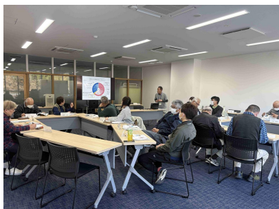
情報提供を行う普及職員

2月12日、須崎地区集落営農組織等代表者連絡会を開催し、集落営農組織9人、関係機関7人が参加しました。