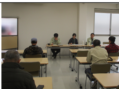
せん定方法について説明する 普及指導員

2月4日、JA土佐くろしお浦ノ内支所において、同管内の土佐文旦栽培者を対象にせん定講習会が開催され、9人が参加しました。当初、園地でせん定講習を行う予定でしたが、渇水により土佐文旦の樹勢が弱っているため、室内での開催になりました。