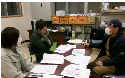
農家と今作を振り返る 普及指導員

1月21、27、28日、JA高知県津野山経済課会議室で、JA営農指導員とともに津野山なす部会の生産者18人と個別経営面談を行い、今作の反省と次作に向けた目標設定を行いました。