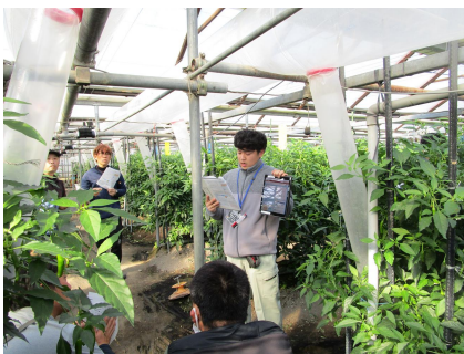
SAWACHIの説明をする 普及職員

1月22日、須崎市池ノ内地区のほ場において、JA土佐くろしおハウスシトウ部会の栽培現地検討会が開催され、9人の生産者が参加しました。