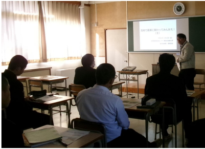
「農業の魅力」を説明する 普及指導員

1月16日、津野山地域営農連絡協議会が、高知県立梶原高等学校の2年生17人を対象に出前授業を開催し、これまで現場で体験指導をしてくれた農家3人も参加した授業となりました。