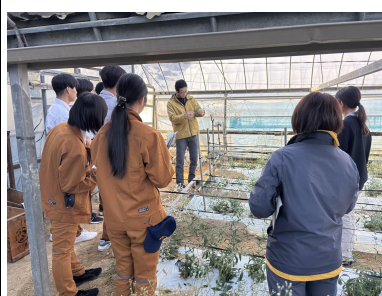
カスミソウについて説明する 生産者

12月16日、黒潮町の花き生産者のほ場2カ所で、幡多農業高等学校の出前授業が開催され、生徒7名が参加しました。