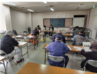
講習内容に耳を傾ける 生産者

1月14日、J A 高知県三崎出張所で、水稻部会の育苗講習会が開催され、生産者11名、関係機関5名、肥料メーカー1社が参加しました。