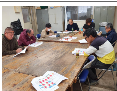
熱心に温湿度管理を学ぶ 生産者

12月16日、JA高知県中村選果場で、トマト部会の勉強会が開催され、生産者7名、関係機関3名が参加しました。