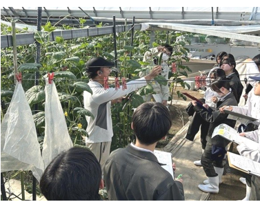
栽培管理について説明する 青年農業士と普及指導員

12月18日、黒潮町の青年農業士のは場で、幡多農業高等学校の出前授業が開催され、生徒15名が参加しました。