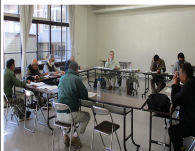
取組方向について提案する 主任

12月16日、宿毛市交流複合施設さくらで、宿毛市集落営農法人等連携協議会「以下、協議会」の設立会議が開催され、3法人と関係機関合わせて10名が出席しました。