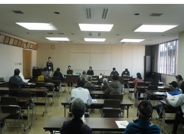
熱心に説明を聞く生産者

12月22日、JA高知県宿毛支所で、宿毛オクラ部会の総会が開催され、生産者25名、関係機関6名が参加しました。