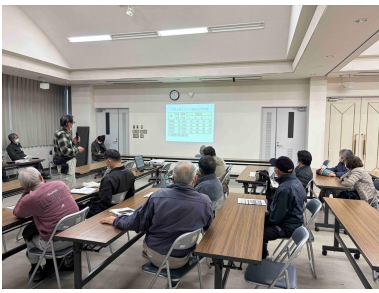
高温対策について説明する 専門員

12月25日、J A 高知県西土佐出張所で、西土佐シシトウ部会の総会が開催され、生産者21名、関係機関9名が出席しました。農業改良普及課からは、今作の振り返り、遮光資材やかん水などの高温対策、家族経営協定、農作業安全について情報提供しました。