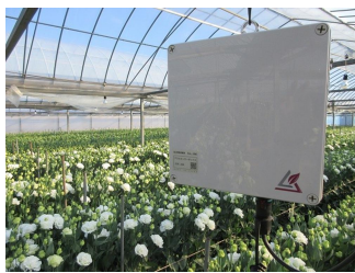
トルコギキョウハウスに環境測定装置を設置

12月2日、安芸市と芸西村のトルコギキョウ生産者5人のハウス計5か所に環境測定装置を設置しました。