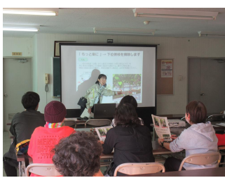
省力化技術を説明する 普及指導員

11月27日、JA高知県赤野集出荷場女性部が勉強会とハウス視察を開催し、生産者13人が参加しました。