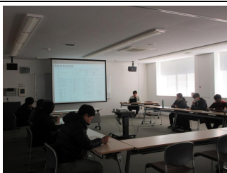
経営計画を説明する 普及指導員

12月10日、安芸農業振興センターで第6回農業基礎研修講座を開催し、管内の研修生や新規就農者、雇用就農者等9人が参加しました。なお、本講座は、今年度最後の開催となり、延べ74人が参加しました。