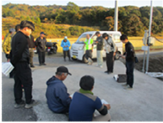
説明を行う普及指導員

12月10日、奈半利町園芸研究会が現地検討会を開催し、ナス生産者や関係機関含め13人が参加しました。