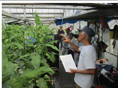
普及指導員が管理の徹底を指導

7月25日、JA高知県津野山園芸部なす部会が津野町のほ場で米ナス現地検討会を開催し、6戸10人が参加しました。