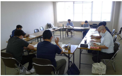
制度等について説明する普及指導員

7月30日、須崎総合庁舎で、須崎地域有機農業推進協議会実務担当者会を開催し、関係機関職員6人が参加しました。