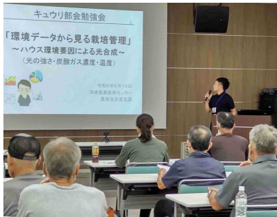
データを活用した栽培管理について説明

8月16日、農業改良普及課はJA土佐くろしおと、JA本所会議室でキュウリ勉強会を開催し、生産者19人が出席しました。