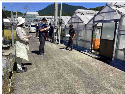
温度管理等について説明する普及指導員

7月30日、JA土佐くろしおが、須崎市のほ場でニラ現地検討会を開催し、生産者7人が参加しました。